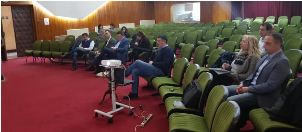
Slika 4. Javne konsultacije u Kragujevcu, 7. februar 2019. godine

Ukupno 16 učesnika prisustvovalo je javnom konsultativnom sastanku u Kragujevcu, uključujući predstavnike Kancelarije za informacione tehnologije i elektronsku upravu, predstavnike svih relevantnih odeljenja administracije Grada Kragujevca, javnih komunalnih preduzeća i zaposlenih koji su uključeni u proces eksproprijacije (Slike 4, 5 i 6).