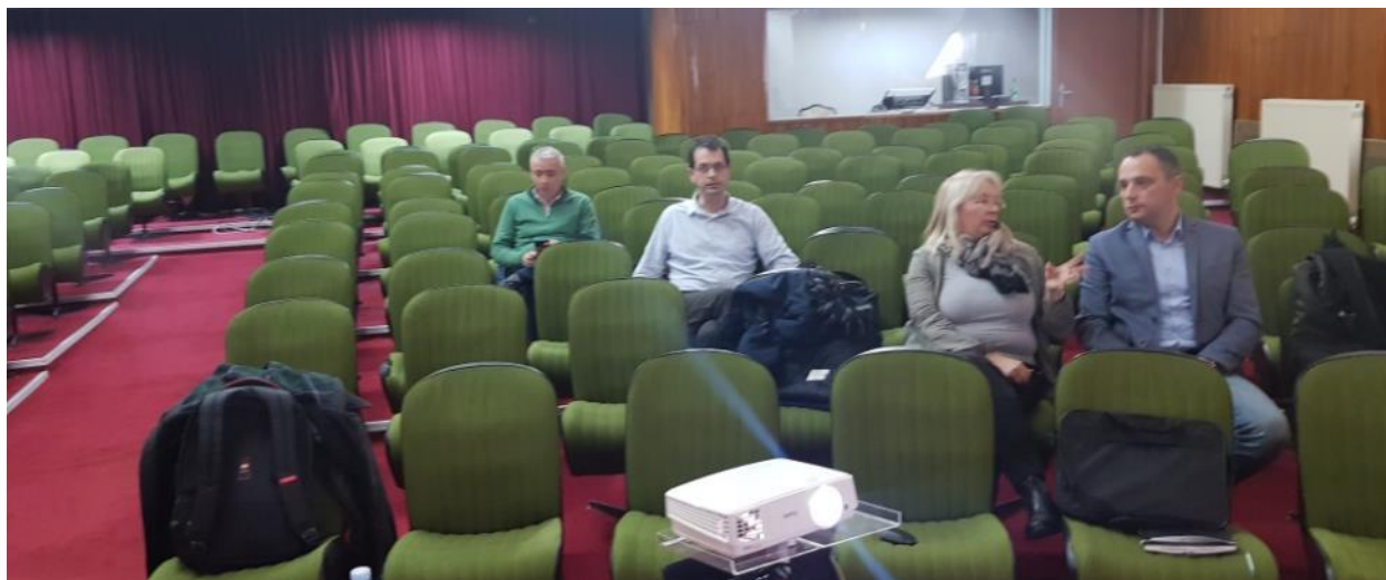
Slika 6. Javne konsultacije u Kragujevcu, 7. februar 2019. godine

Sastanak je počeo prema rasporedu u 12:00 časova. Predstavnici Kancelarije za informacione tehnologije i elektronsku upravu su detaljno predstavili ESMF dokument zainteresovanim učesnicima. Tokom javnih konsultacija razmatrane su sledeće teme: