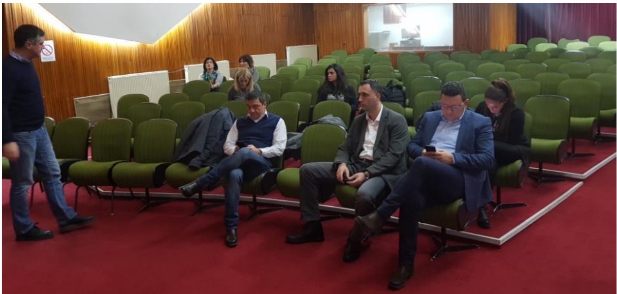
Slika 5. Javne konsultacije u Kragujevcu, 7. februar 2019. godine